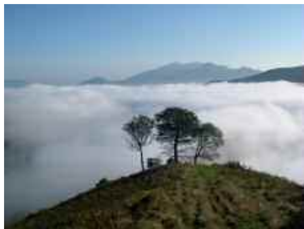
Brume automnale à Baigorri