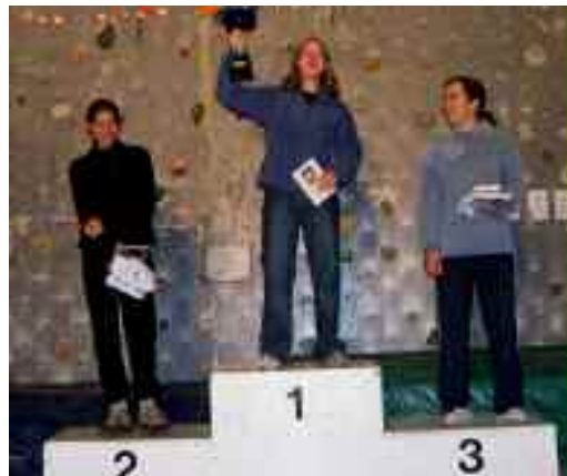
Armiarma 2003 : 2 magnifiques podiums pour les filles d' Auñamendi