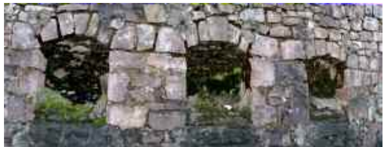
Détails des trémies sur le site de Erraustine

Carte IGN au 1/25000 top 25 13450T Cambo les Bains