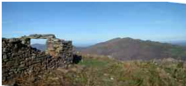
Palengoborda : au milieu des travers-bancs du filon d'Ustelegi

Les travers-bancs sont des galeries d'assistance mais pas d'exploitation, ils sont parsemés de cheminées qui créent des appels d'air .