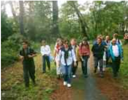
Dans le bois du Lazaret

10h15 à l'abri des premières gouttes de pluie, halte