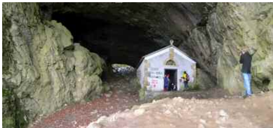
Sandrati tunela (Aizkorri)