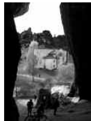
Ermita de San Bartolome (rio Lobos-Soria)