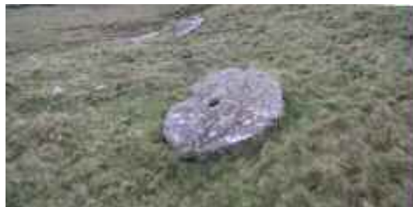
pierre taillée sur l'Artzamendi