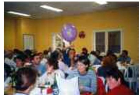
Les charmes de la rando AA