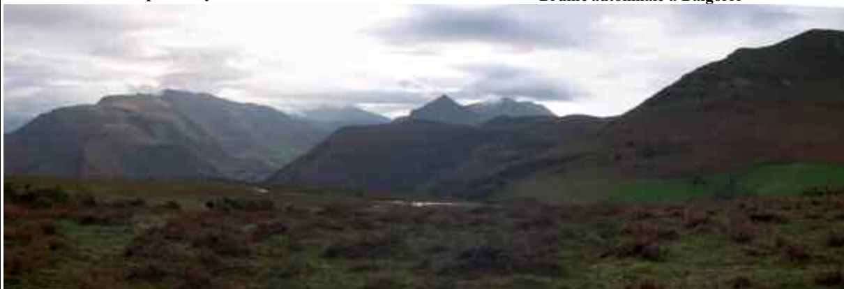
depuis le Plateau vert : Iparla, Irubelakaskoa , Artzamendi ; « Irukasko »