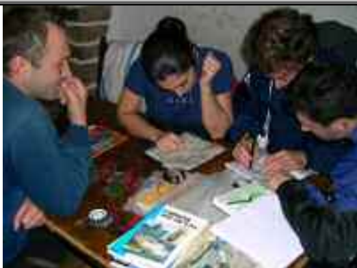
stage cartographie-orientation 29-30 novembre 2003