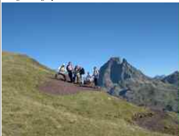
en descendant du pic d'Ayous