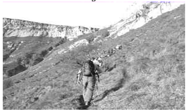
Marche populaire d' Amurrio ( 6 Nov.) 2500 participants