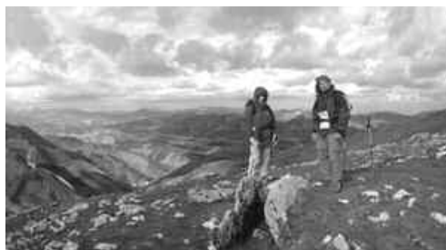
Tumulus-cromlech d' ARANZADI

Arraztaran gaina, Jentilaharri (dont la pierre supérieure est restaurée) et son monolithe caché, Uidui (3 stations). La rando se poursuit jusqu'au col d' Irazusta en n'omettant pas le passage par Zearragoena et Uelagoena (un peu à l'écart). Après le monolithe d'Irazusta, nous traverserons le plateau d' Alotza jusqu'à Saltarri (monolithe) . Divers monuments plus modernes attireront l'oeil du visiteur .Le chemin nous mènera jusqu'à Zirigarate Behekoa pour rejoindre la voie normale du Txindoki . Pas de problème alors pour rentrer à Larraitz.