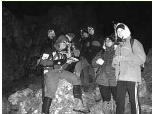
Marche de nuit du WE cartographie orientation sur le Baigura