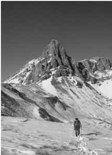
Au pied de l'imposante face est de la Table des 3 Rois