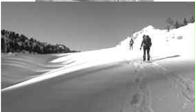
Plaisir de la raquette dans les bras de la PSM .