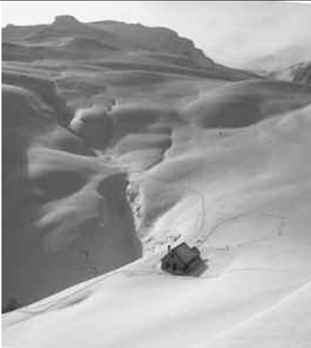
Première neige à Eskantola ( Xuberoa)