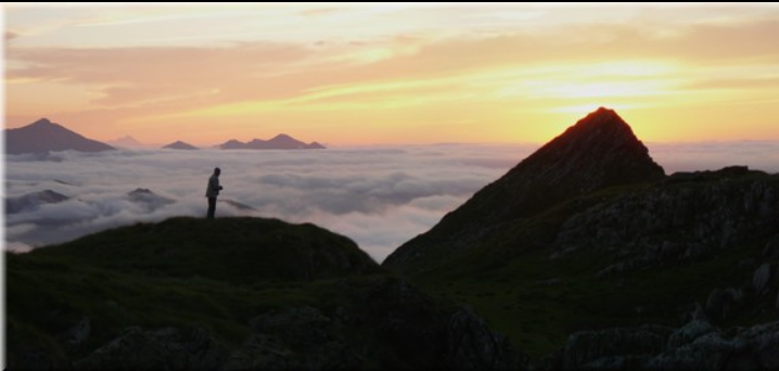
Réserve du mont Vallier - coucher de soleil - cabane des Espugues